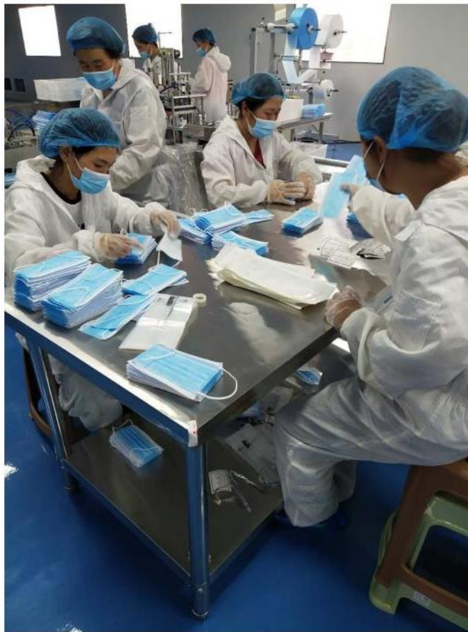
三) 質檢人員檢驗口罩, 裝包裝袋工序