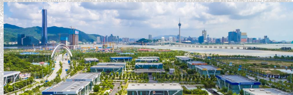
華發集團橫琴金融產業基地